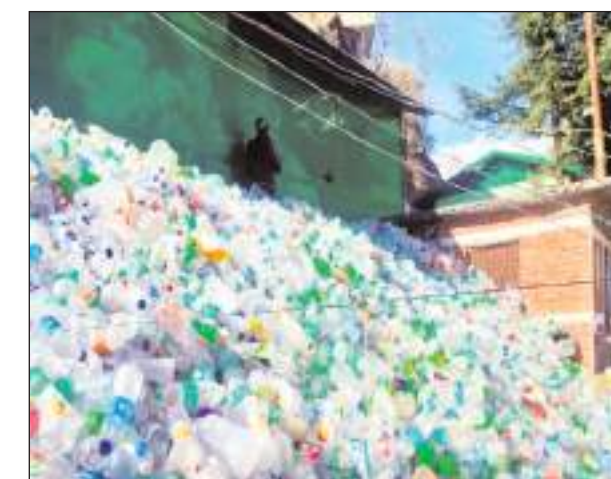
नगर पालिका जोशीमठ ईओ एचएस रौतेला के अनुसार जोशीमठ नगर की सफाई व कूड़ा

जोशीमठ/टीएम एक्शन इंडिया सीमान्त नगर पालिका परिषद जोशीमठ बेहतर कूड़ा प्रबंधन कर कूड़ा विक्रय कर करोड़पति बन गई है। स्वच्छ भारत मिशन 'शहरी' के अंतर्गत टोस अपशिष्ट प्रबंधन के तहत वर्ष 2011-12 से मार्च 2024 तक नगर पालिका जोशीमठ द्वारा नगरीय क्षेत्र में डोर टू डोर कूड़ा एकत्रीकरण कर 35 प्रकार के कूड़े को वैज्ञानिक तरीके से निस्तारण व गुणधर्मों के आधार पर पुनर्चक्रण कर विक्रय किया जा रहा है। जोशीमठ नगर पालिका द्वारा अब तक 12लाख 78 हजार 369 किग्रा कूड़े का विक्रय कर 1 करोड़ 26 हजार 162 रुपये की आय अर्जित की है।