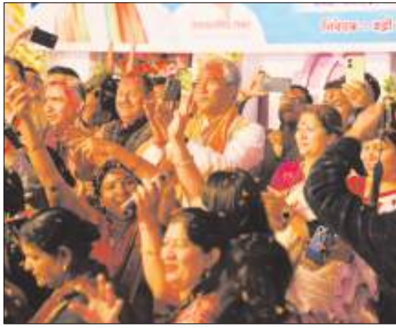
(भाजपा) के हरिद्वार लोकसभा उम्मीदवार पूर्व मुख्यमंत्री त्रिवेन्द्र सिंह शामिल हुए। इस दौरान उन्होंने सभी को होली की शुभकामनाएं देते हुए कहा कि सभी कार्यकर्ताओं से एकजुटता के साथ चुनाव की तैयारी में जुटने को कहा।

8 बंदी-केदार सहयोग समिति की ओर से बालावाला में होली मिलन कार्यक्रम हुआ।