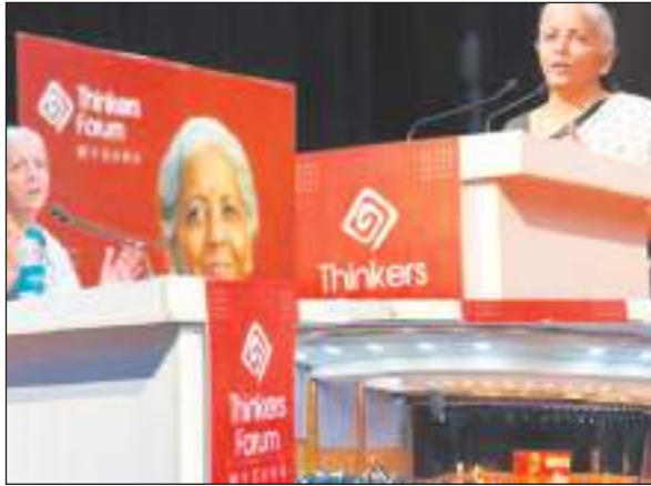
सरकार के 10 वर्षों की तुलना में 3.5 गुणा अधिक है।

सीतारमण ने शिक्षा विदों को संबोधित करते हुए कहा कि बेंगलुरु में 14.68 लाख जनधन खाते खोले गए,