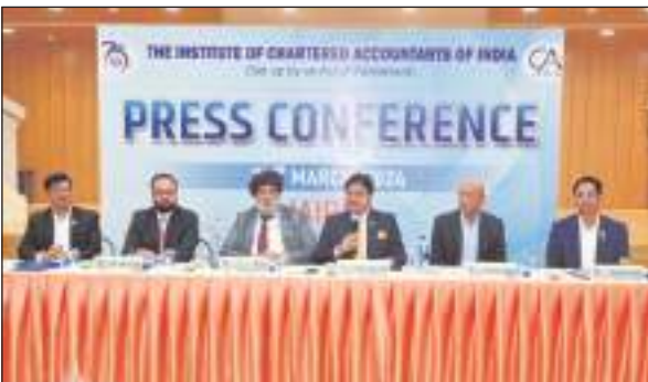
आईसीएआई एक 'विजन डॉक्यूमेंट 2049' लेकर आया जो विद्यार्थियों और सदस्यों के विकास, नियामक और रिपोर्टिंग तंत्र को मजबूत करने, एआई जैसी नए युग की तकनीकी प्रगति को अपनाने और विकास में सीए के योगदान,

जयपुर/टीएम एक्शन इंडिया इंस्टीट्यूट ऑफ चार्टर्ड अकाउंटेंट्स ऑफ इंडिया (आईसीएआई) ने अपने गठन के 75 साल पूरे होने का जश्न मनाते हुए 21 और 22 मार्च को जयपुर में सेंट्रल ऑफ एक्सिलेंस (सीओई) में दो दिवसीय बैठक आयोजित की। बैठक में आईसीएआई के पूर्व प्रेसिडेंट और सेंट्रल काउंसिल सदस्यों ने 'विकसित भारत 2047' में चार्टर्ड अकाउंटेंट्स की महत्वपूर्ण भूमिका के बारे में चर्चा की। साथ ही पेशे के लिए अगले 25 वर्षों के लिए एक रोडमैप की रूपरेखा तैयार की, जब आईसीएआई अपने शताब्दी वर्ष के करीब पहुंच जाएगा।